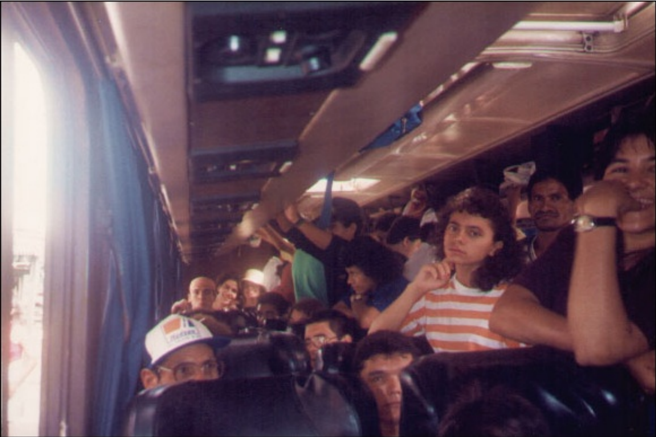
Werkblad 4: Foto 1